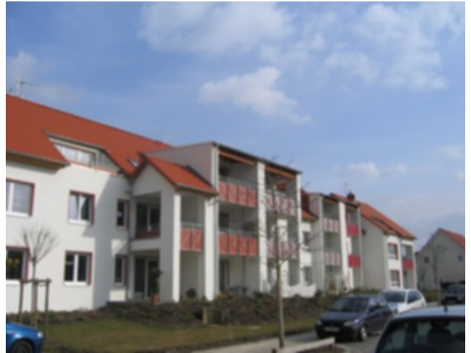
Ansicht Garten 02