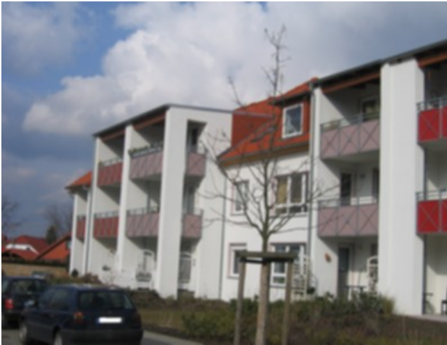
Ansicht Garten 01