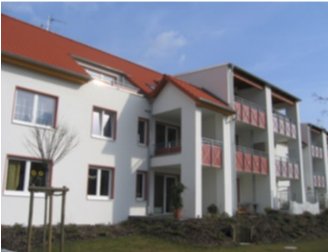
Ansicht Garten 03